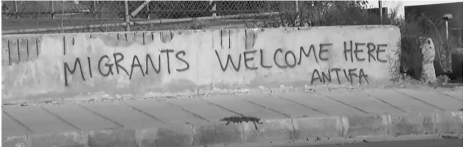
Σύνθημα που γράφτηκε από συντρόφους/ισσες που επισκέφτηκαν τις επόμενες μέρες στο συγκρότημα «St. Nicholas»

Μέσα σε αυτό το ρατσιστικό κλίμα, οι «Επιτηρητές Χλώρακας» διοργάνωσαν πορεία διαμαρτυρίας στις 27 Αυγούστου, «ενάντια στην ανεξέλεγκτη μετανάστευση, την γκετοποίηση και την παραβατικότητα» ώστε να «γίνει η αρχή να σπάσουν τα γκέτο κάθε χωριού και κάθε γειτονιάς της Κύπρου». Το ρατσιστικό κλίμα ενισχύθηκε και από διάφορα περιστατικά που έγιναν εκείνες τις μέρες, όπως διάφορα βίντεο που κυκλοφόρησαν και ειδήσεις για καυγάδες μεταξύ οδηγών[16] αλλά και εγκλήματα, για τα οποία έριχναν το φταίξιμο χωρίς καμία απόδειξη (εννοείται) στους μετανάστες.